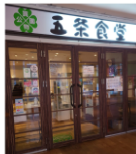
2月4日の夕方、2人で行った五条食堂

工房のことも、もっと地元の人に 知ってもらって親しまれる事業所に なっていけばいいかなと思いました。 J