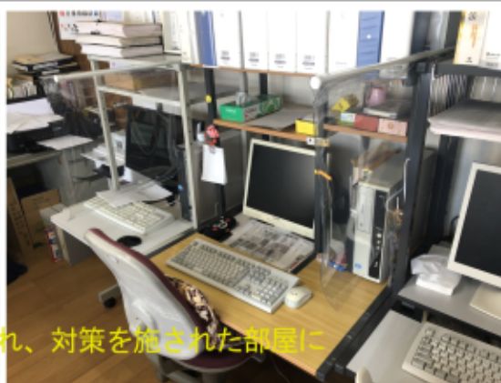
各デスク毎に仕切られ、対策を施された部屋に

65歳以上の人のコロナワクチ ン3回目接種も始まりました。 工房の感染対策もばっちりな ので、このままクラスターを 出さず、皆で無事乗り越えま しょう。 M