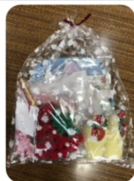
写真上はワンセット500円の品です

かがやき工房では利用者様も募集しておりますのでこの機会にご検討いただければ幸いです。 J