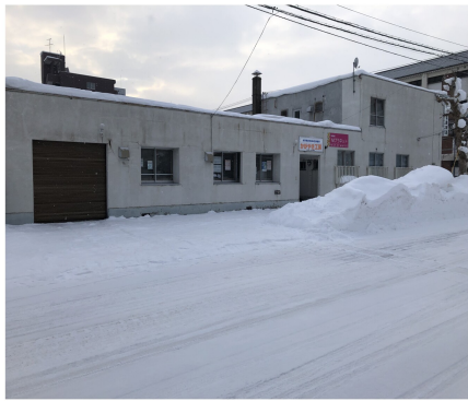
(写真は除排雪して綺麗になった工房前)